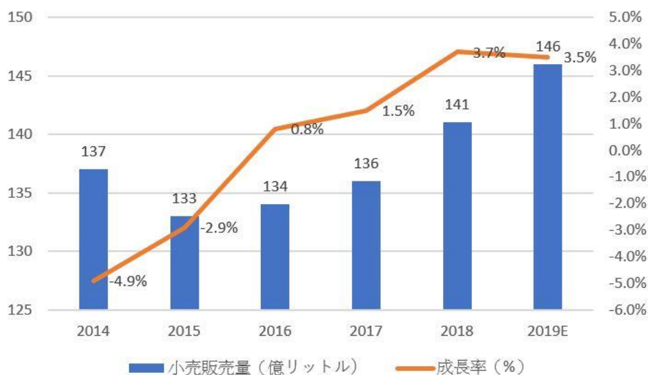
【中国の果汁及び果汁飲料の小売販売量統計】

2018年、中国の果汁及び果汁飲料の小売販売量は141億リットルで、前年比3.7%増加した。2019年には146億リットルに達することが見込まれる。