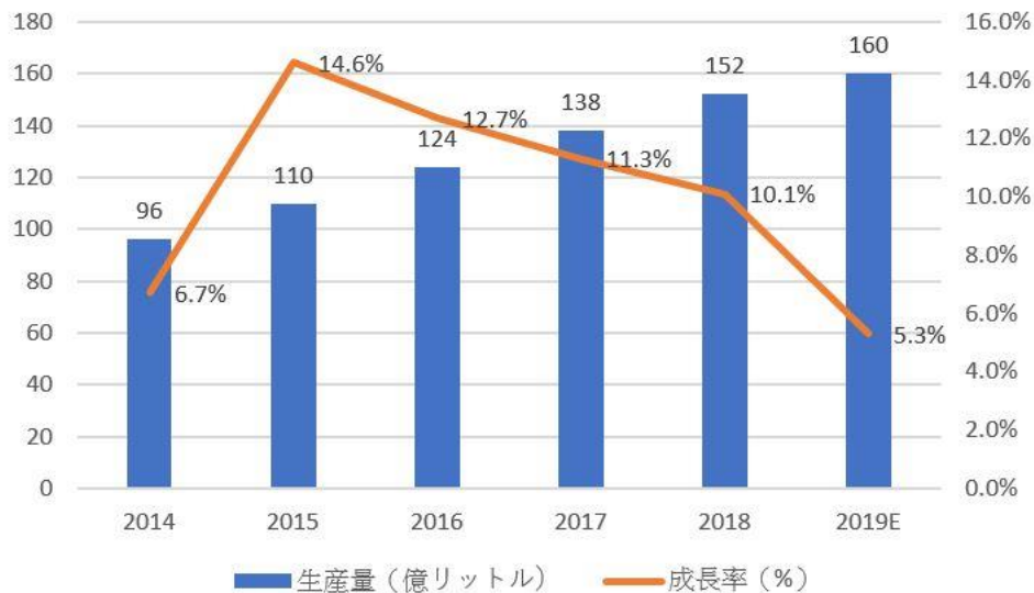
【中国の果汁及び果汁飲料の生産量統計】

2018年、中国の果汁及び果汁飲料の生産量は152億リットルで、前年比10.1%増加した。2019年には160億リットルに達することが見込まれる。