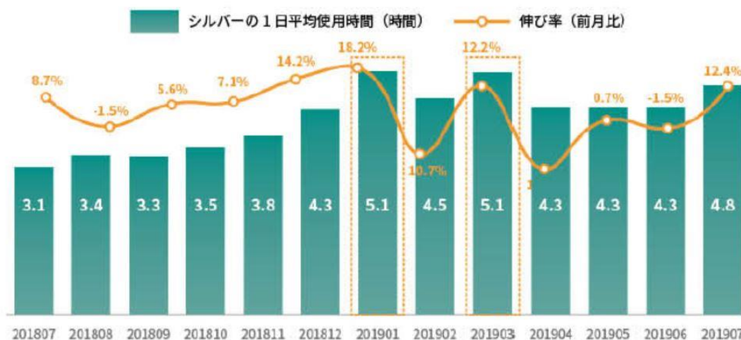
【図2】ミドルシニア層のモバイルの1日平均使用時間