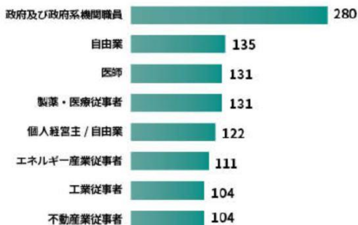
【図2：ミドルシニア層のモバイルユーザーの職業別分布】

男性の比率が若干高く 53.9%を占める。職業では国有企業含む政府系機関が最も多い。一般に学歴が高く、中高年層で最も早くからインターネットに触れている層といえる。